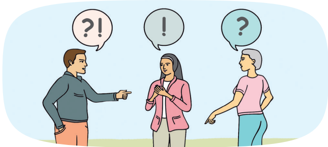
Workshops für Jugendliche und Erwachsene

Wir wollen mit sehr unterschiedlichen Menschen über ihre eigenen Werte und Interessen und über Demokratie und Menschenrechte ins Gespräch kommen. Dafür nutzen wir: