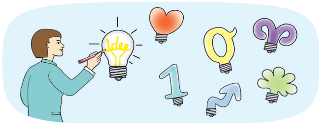
Spannende Formate und Methoden