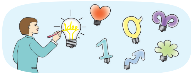
Spannende Formate und Methoden