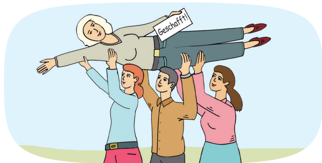
Fortbildungen für Fachkräfte in der Bildungs- und Sozialarbeit